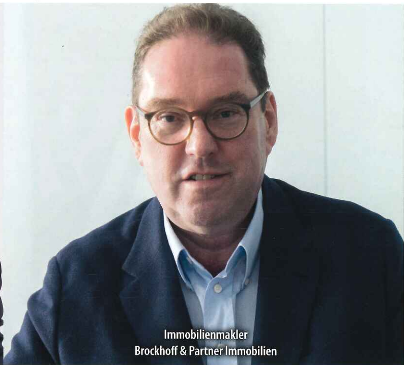
Immobilienmakler Brockhoff & Partner Immobilien